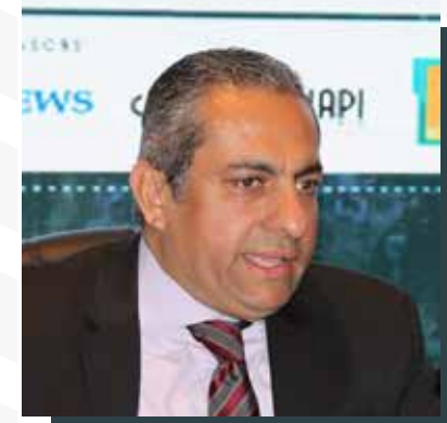
م. خالد عباس نائب وزير الاسكان للمشروعات القومية