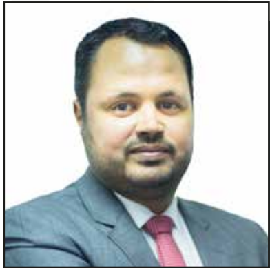
سعد زغلول الرئيس التنفيذي جريدة البورصة