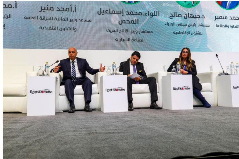
قمة إيجيبت أوتوموتيف

تحت رعاية وزارة الصناعة ووزارة الاستثمار والتجارة الخارجية الدورة