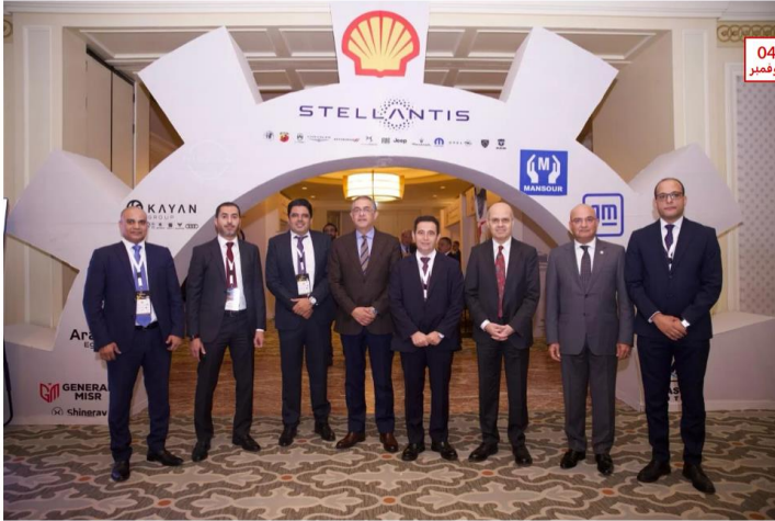
كتب : ماهر بدر

تستعد العاصمة المصرية لاستضافة الدورة السنوية التاسعة لقمة "إيجيبت أوتوموتيف"، التي سيعقد في القاهرة يوم 26 نوفمبر الجاري، وذلك تحت رعاية وزارة الصناعة ووزارة الاستثمار والتجارة الخارجية. تأتي هذه القمة استمراراً لمسيرة النجاح المتميز الذي حققته الدورات السابقة في دفع عجلة تطوير صناعة السيارات في مصر وتعزيز موقعها في الأسواق الأفريقية. تركز القمة هذا العام على استثمار النجاحات السابقة، من خلال دعم الصناعة المحلية، وزيادة الصادرات، وتفعيل اتفاقية التجارة الحرة لدخول أوسع إلى السوق الأفريقية. كما تهدف القمة إلى مناقشة سبل تعزيز الشراكة بين الحكومة والقطاع الخاص، لوضع أسس ومعايير جديدة لسوق السيارات المصرية، مما يعزز تنافسية المنتجات المحلية في الأسواق العالمية.