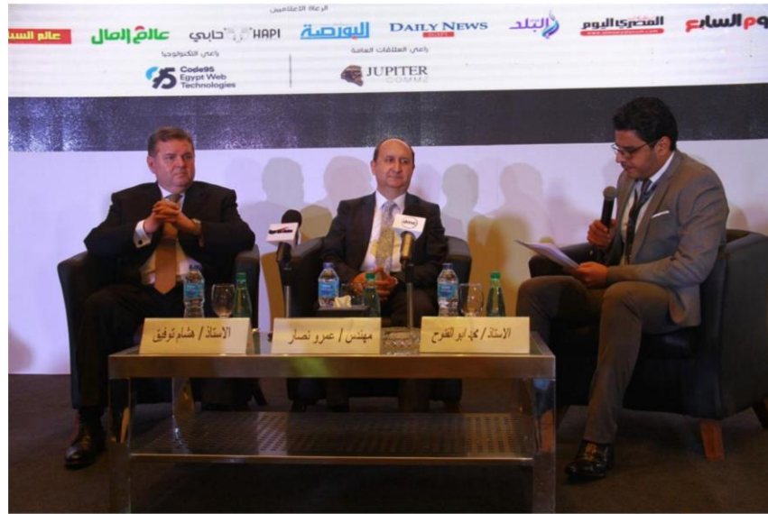
اجتماعين نيوز / ANN